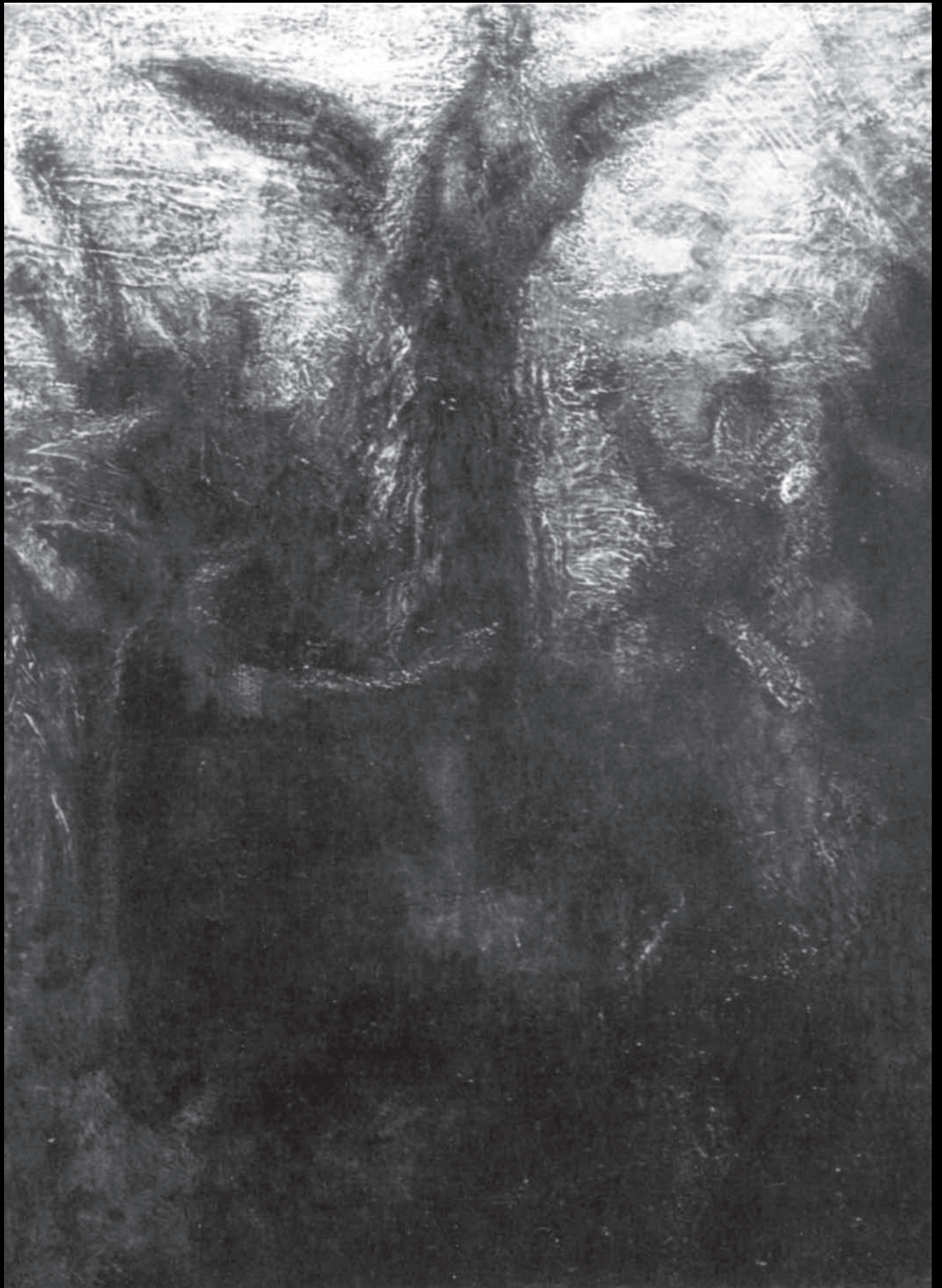
Jean Theodore Fantin-Latour: Prélude de Lohengrin (Öl auf Leinwand um 1877) Vom Klang der Bilder. München 1985