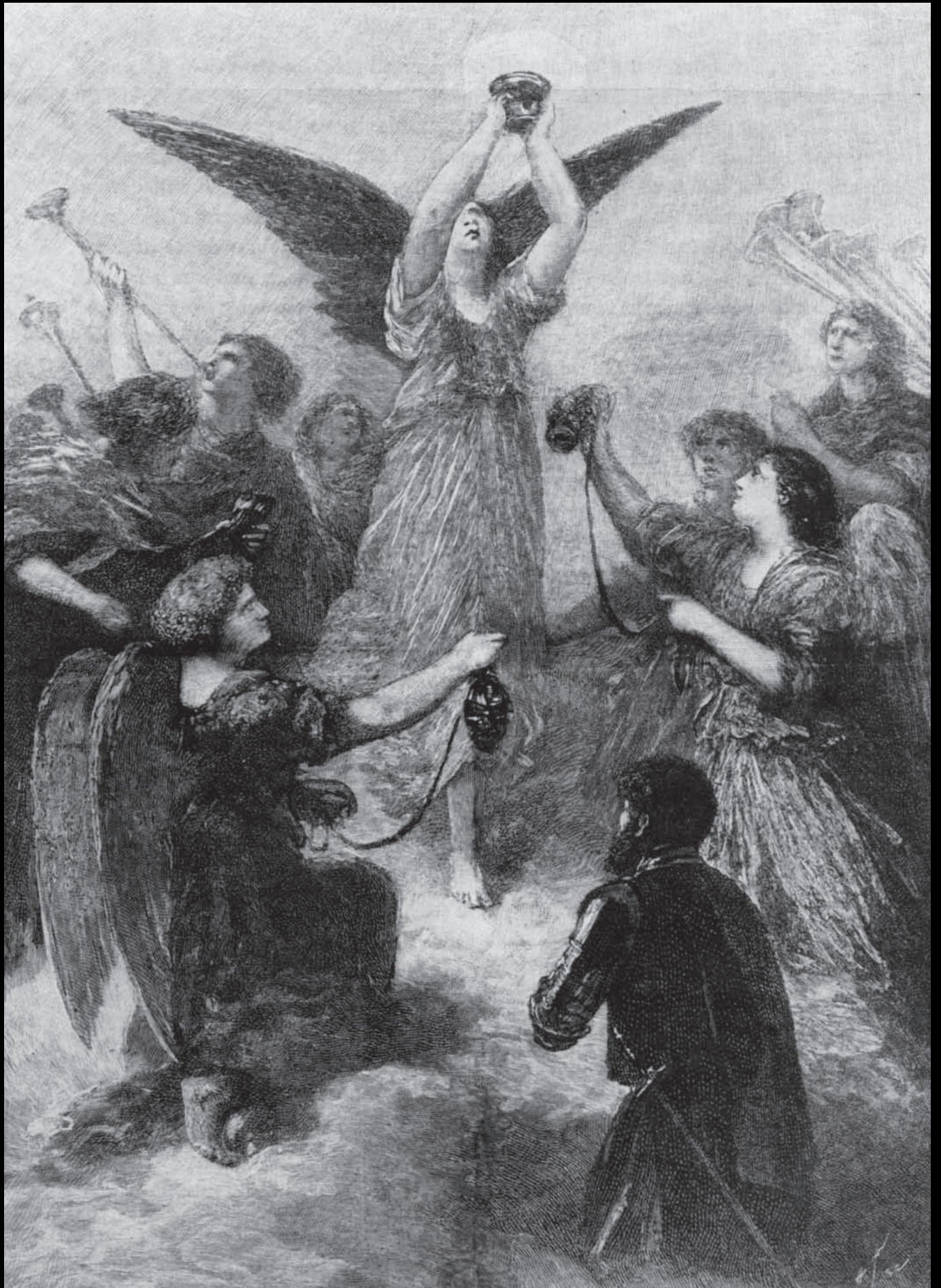
Jean Theodre Fantin-Latour: Prélude de Lohengrin (Litographie 1882) Bayreuther Festspiele (Programmheft „Lohengrin“ 1980)